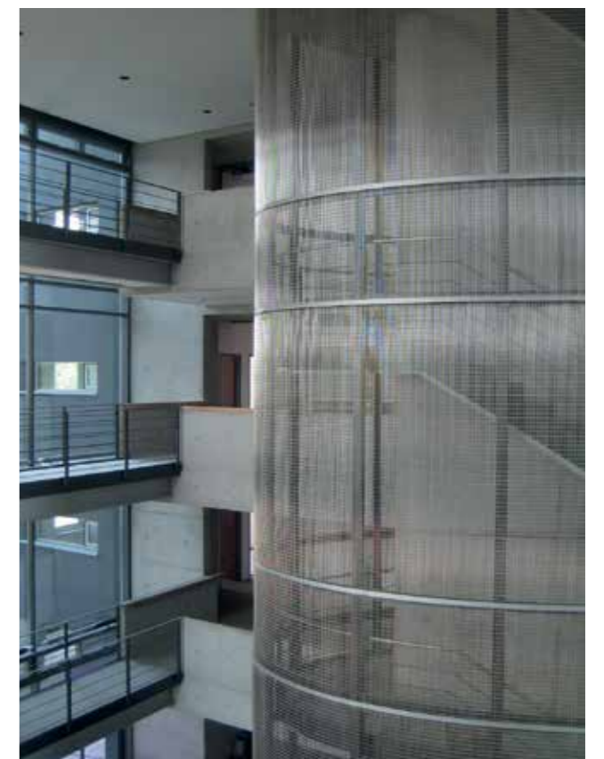
Bilder 1-3: Phelps Dunbar, Baton Rouge, Louisiana, Architekt: Gensler, Gewebe: Futura 3110