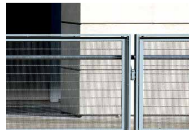
Titel + Bild 4: The Art Institute of Chicago, Illinois, , Architekt: Renzo Piano, Frankreich, Gewebe: Tigris PC